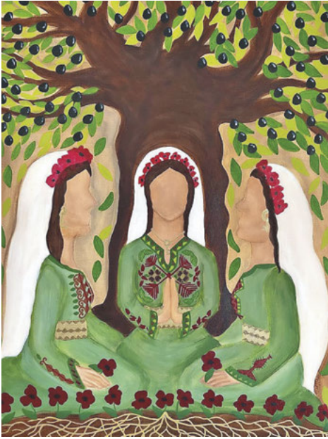
Bild: Titelbild 2024 Palästina

Palästina für die Liturgie ausgewählt – einem Land, das als winziger Fleck im Nahen Osten für die drei abrahamitischen Religionen von Bedeutung ist: Judentum, Christentum und Islam.